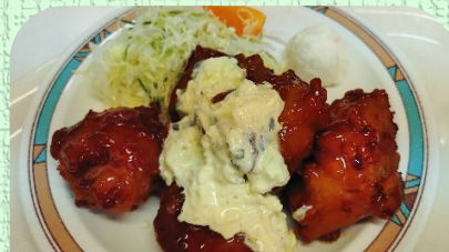
チキン南蛮定食 ¥900 単品 ¥750