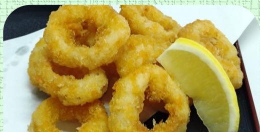
イカリングフライ ¥500