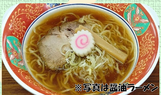
※写真は醤油ラーメン