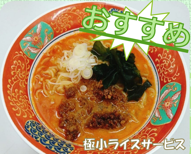
極小ライスサービス