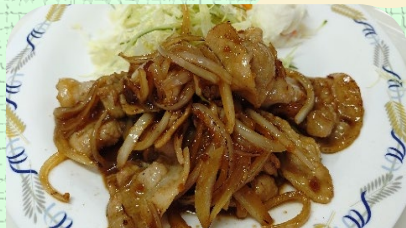
生姜焼き定食 ¥860 単品 ¥700