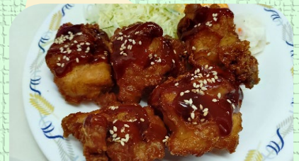
ヤンニョムチキン定 ¥900 単品 ¥750