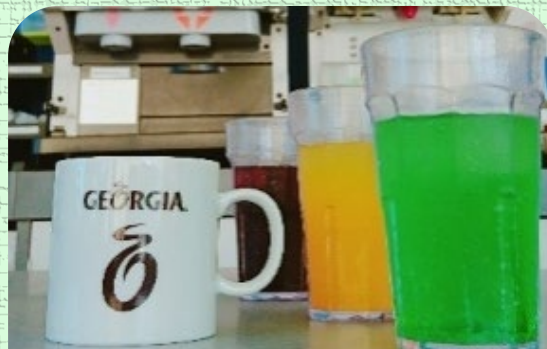
ドリンクバー単品 ¥400

パークヒルは税込み価格表示です。仕入状況により一部内容が変更する場合がございます。