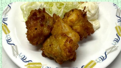
唐揚げ3個定食 ¥720 ※唐揚げ3個の単品はありません