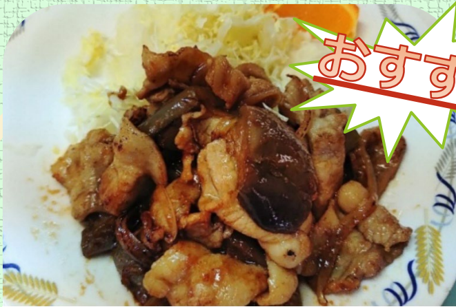
豚肉と茄子の味噌炒め定食 ¥900 単品 ¥750