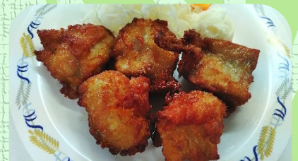
唐揚げ5個定食 ¥860 単品 ¥600