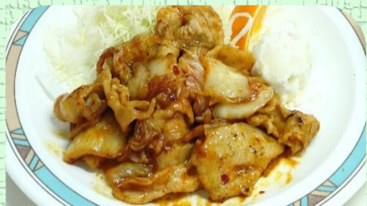
豚キムチ定食 ¥860 単品 ¥700