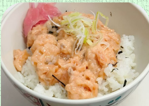
サーモンたたき丼 ¥ 900