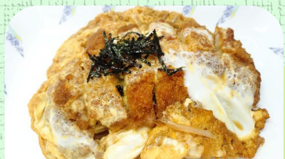
かつ煮定食 ¥900 単品 ¥750